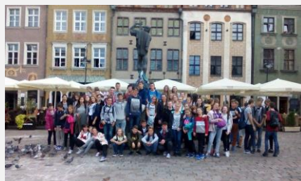
Szkolna wycieczka do Poznania