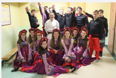
Szkolny Wieczer Talentów