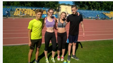
Bierzemy udział w licznych zawodach sportowych, zdobywając medale 😊