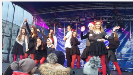
„W zimowej krainie Mikołaja” – cykliczna impreza współorganizowana przez NG na puckim rynku