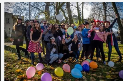
Jesteśmy radośni i optymistycznie patrzemy na świat