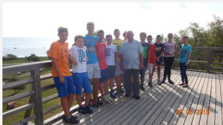
Integracyjny wyjazd klasy pierwszej Rzucewo 2015r.